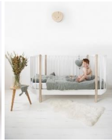
Les Rêves d'Anaïs